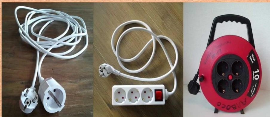
VERDEELSTEKKER / VERLENGKABEL